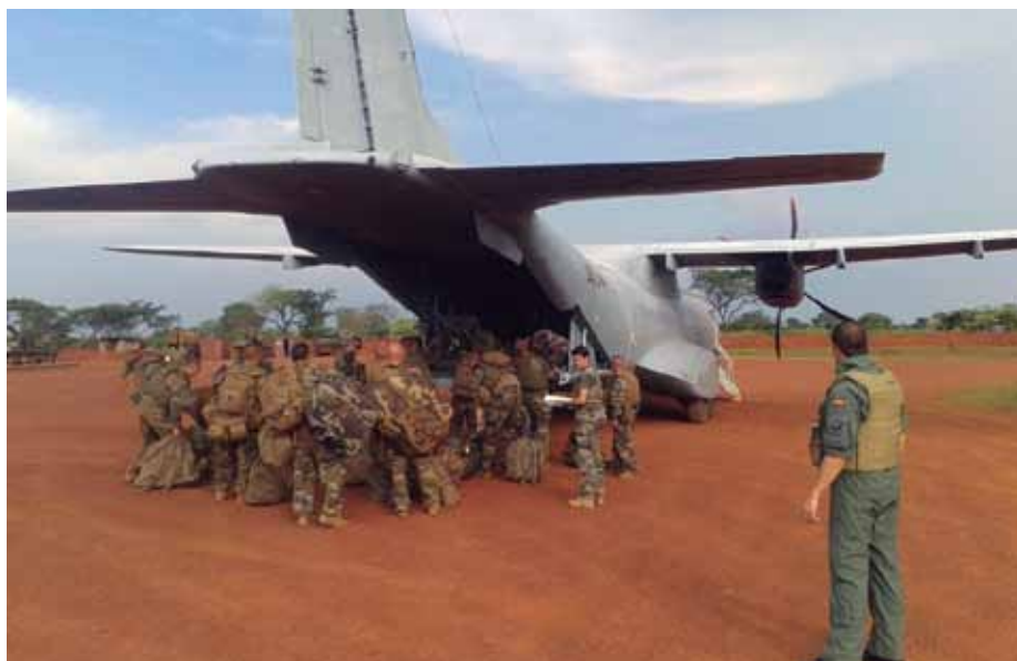
El avión C-295 del destacamento Mamba realizó el 4 de noviembre su primera misión de transporte al aeródromo de Bambari, en la República Centroafricana.

En este entorno, las fuerzas de operaciones especiales se revelan como un instrumento muy eficaz, por su flexibilidad y autonomía. Sus equipos operativos proporcionan elementos de maniobra ligeros que, ante la amenaza, responden de forma contundente y precisa, minimizando daños colaterales. España es, junto a EEUU, Gran Bretaña, Turquía, Italia, Francia y Polonia, uno de los pocos países de la OTAN que han acreditado su capacidad