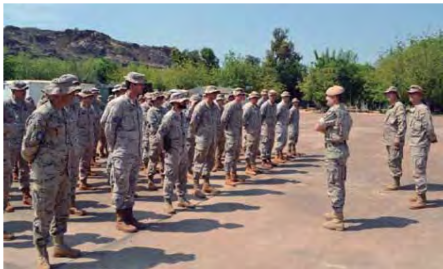
El general Alfonso García-Vaquero, comandante de EUTM-Malí, despide en Koulikoro a los militares que han formado el cuarto contingente en la misión.

Un nuevo grupo de instructores se incorpora a la misión europea