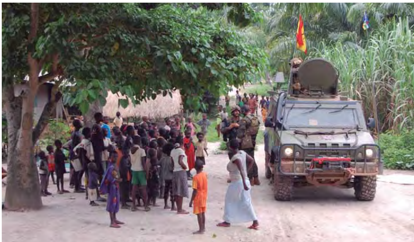
Los boinas verdes españoles patrullan los distritos más convulsos de la capital centroafricana para proteger a la población del caos y la violencia de los grupos criminales que asolan el país desde el golpe de Estado de marzo de 2013, detonante inicial del conflicto.

El conflicto se originó en marzo del pasado año, cuando los cinco grupos de identidad musulmana integrados en Seleka dieron un golpe de Estado, deponiendo al presidente François Bozizé. Los enfrentamientos entre las milicias Anti Balaka (cristianos) y Seleka ocasionaron un éxodo de cerca un millón de personas hacia los países fronterizos,