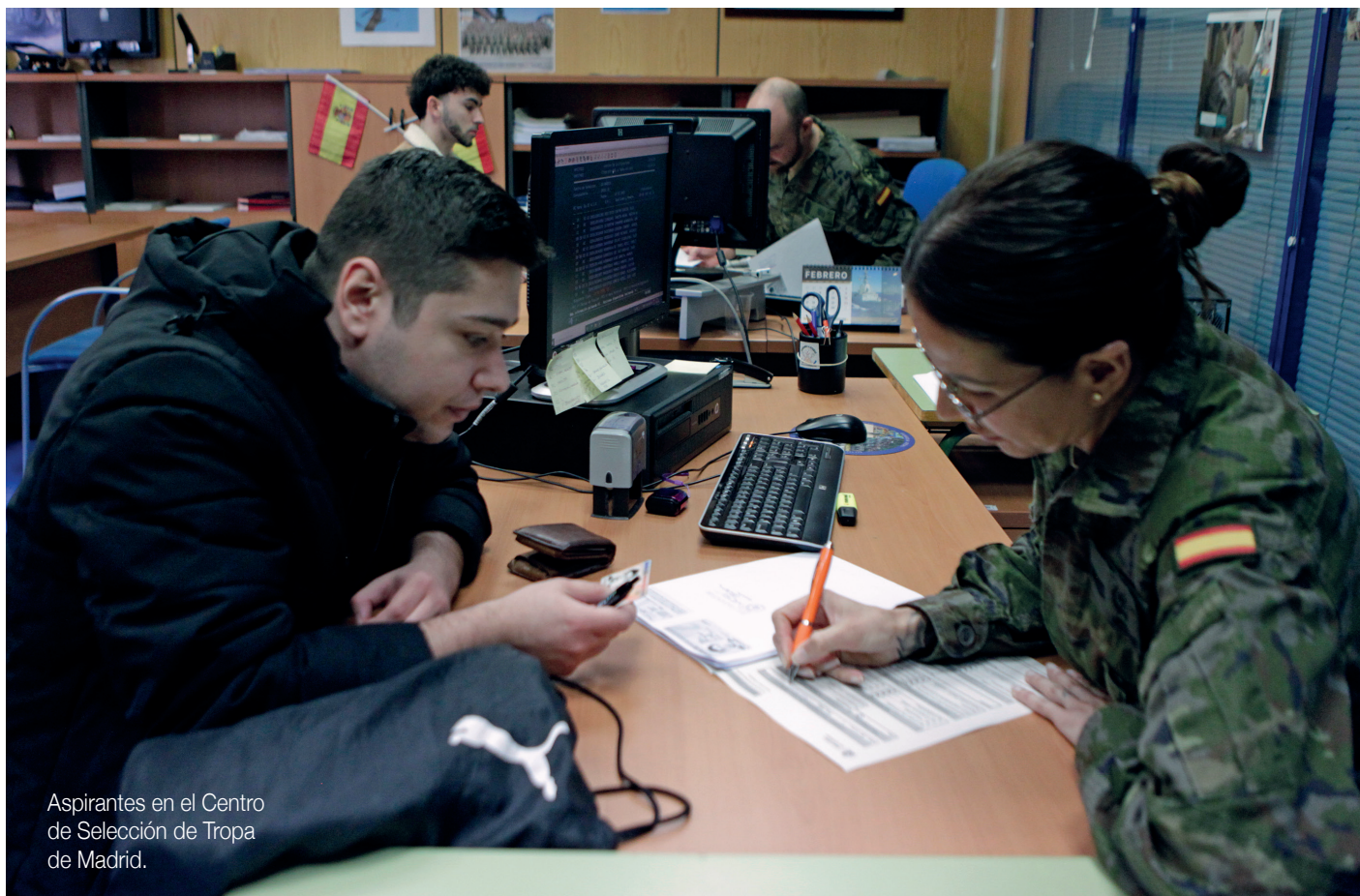
Aspirantes en el Centro de Selección de Tropa de Madrid.