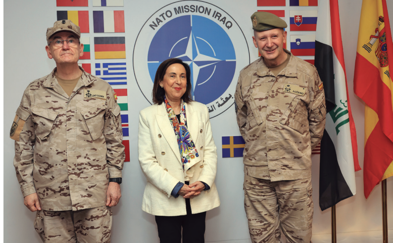
La ministra de Defensa saluda a una militar de la fuerza de protección en la base Union III ; con el JEMAD y el teniente general Agüero, jefe de