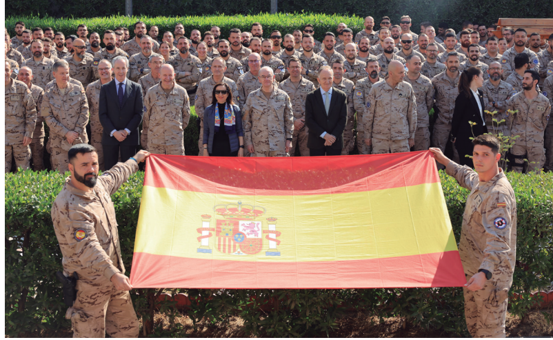
la misión de la OTAN en Irak; conversación con miembros del contingente y la delegación con una representación de los militares españoles.