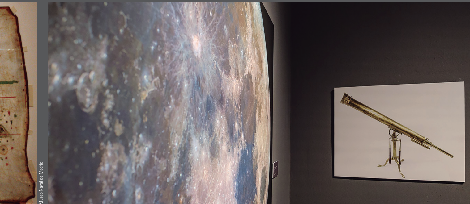
Museo Naval de Madrid