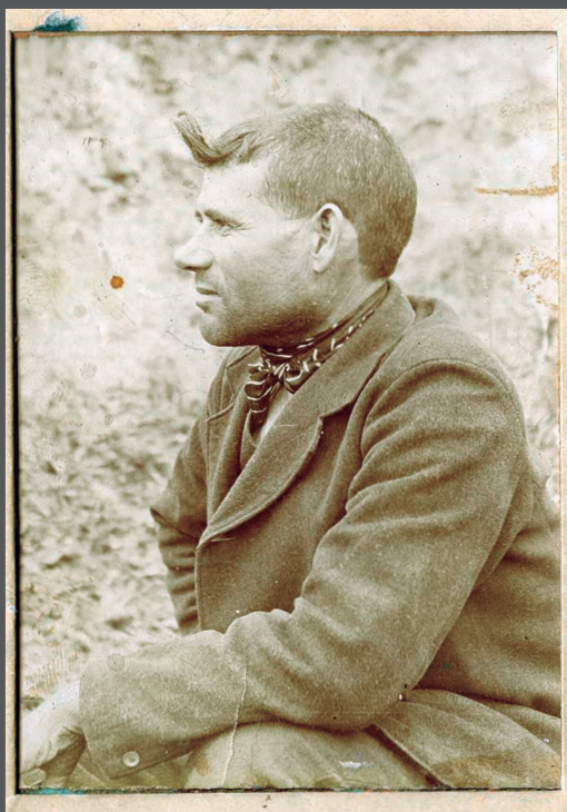
Museo del Ejército