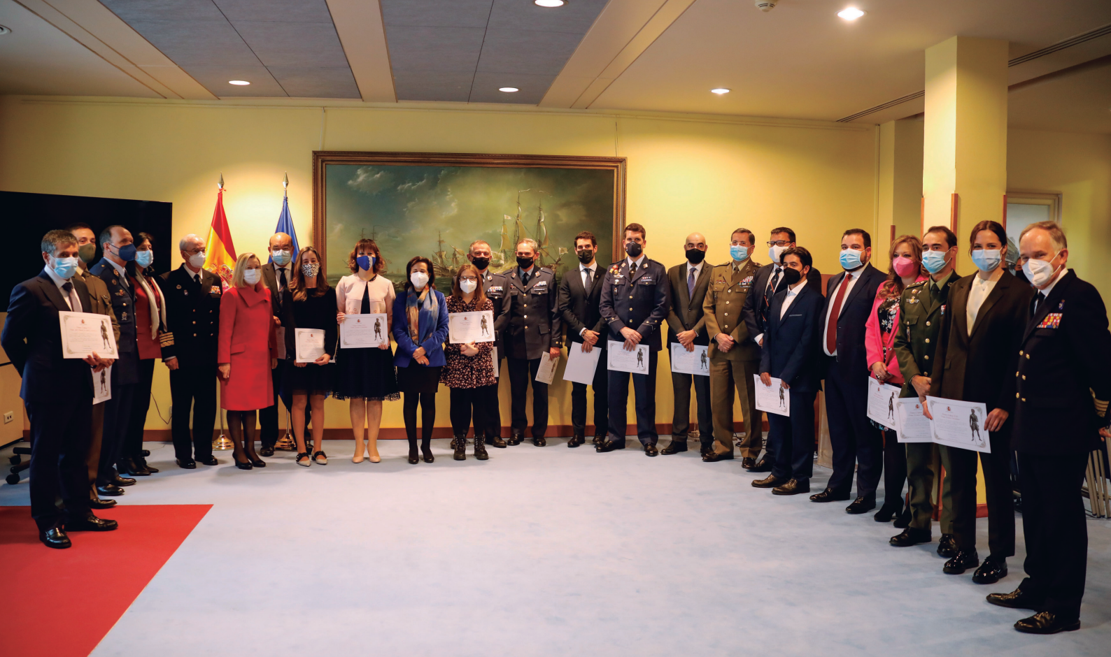
Los galardones se entregaron en el salón de actos Teniente General Veguillas, en la sede central del Ministerio de Defensa.