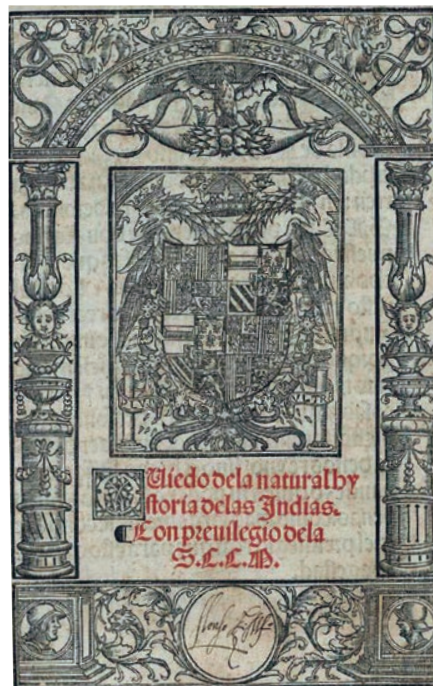
Biblioteca Nacional de España

En paralelo, fue designado otra vez gobernador de San Juan y capitán de la armada que debía castigar a los indios caribes, quienes, en connivencia con nativos locales, habían lanzado en los años