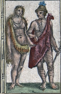
Reyes de Florida. Ilustración del Atlas de los Hermanos Blaeu (1647).

BAHÍA DE TAMPA BAHÍA DE CARLOS (Establece un asentamiento)