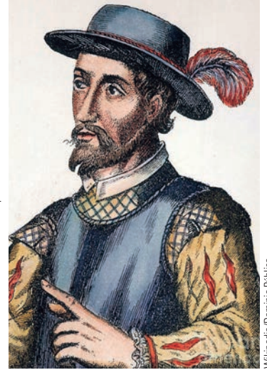
De izquierda a derecha, modelo de la Santa María de Colón e instrumentos para la navegación de altura (exposiciones del Museo Naval), detalle recreación poblado taíno (Museo Ponce de León) y retrato de Ponce.

precedentes constantes incursiones sobre los asentamientos españoles.