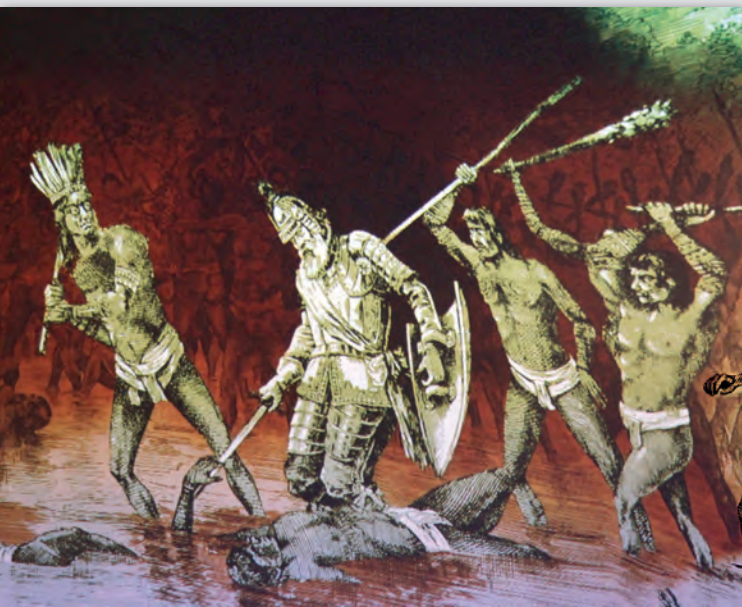
Recreación de la muerte de Magallanes, en la exposición del Museo Naval en 2019.

Portada sobre la singular circunnavegación en Google Arts & Culture.