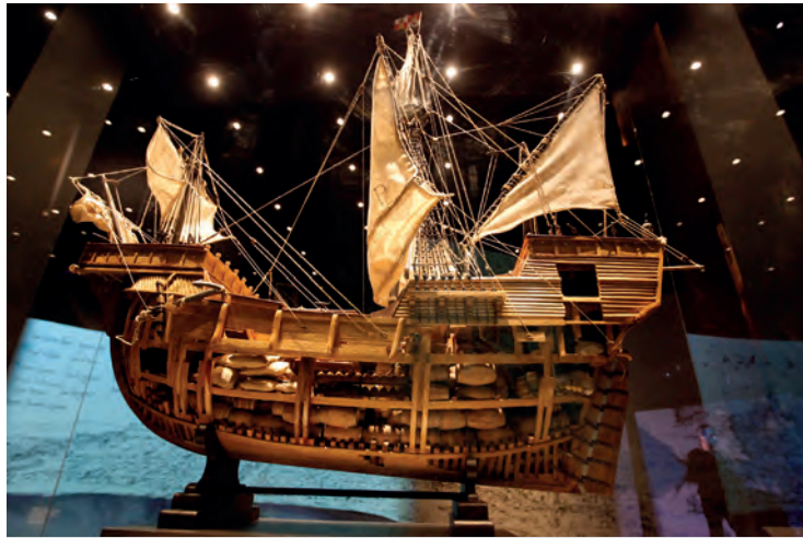
Modelo de la nao Victoria , hecho para la muestra conmemorativa del Museo Naval.

En los tres casos, los documentos pertenecen a la colección del Museo Naval de Madrid. La institución cultural de la Armada se ha sumado, además, al portal digital La primera vuelta al