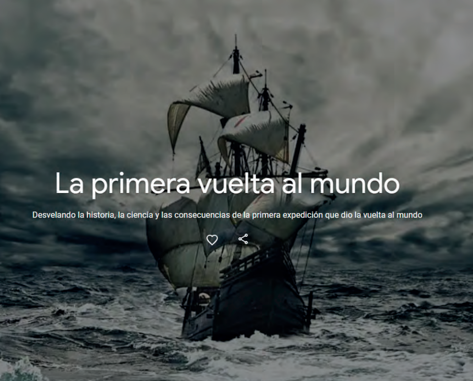
Google Arts & Culture

Desvelando la historia, la ciencia y las consecuencias de la primera expedición que dio la vuelta al mundo