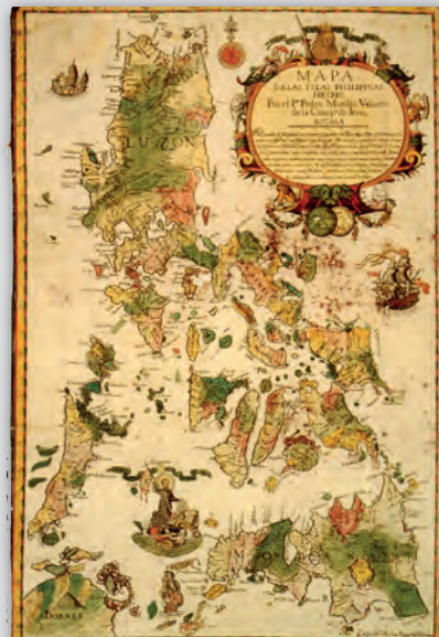
Museo Naval de Madrid