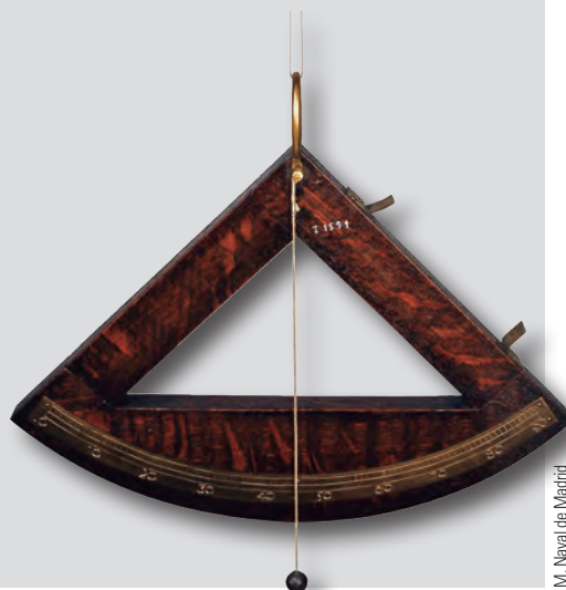
M. Naval de Madrid