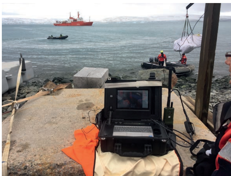
El buen funcionamiento de las señales PRS se ha comprobado en zonas de grandes latitudes, como la Antártida.

En periodos de estabilidad, es posible acceder sin restricciones a cualquiera de los servicios que ofrecen las constelaciones satelitales de alcance global, como la europea Galileo , la norteamericana GPS, la rusa GLONASS o la china Beidou . Pero cuando surge un conflicto grave a gran escala, o una nación tiene desplegadas unidades militares en una zona de operaciones con un enemigo real, «ya no es posible tener la completa seguridad de contar con un servicio de navegación, posicionamiento y sincronía fiable