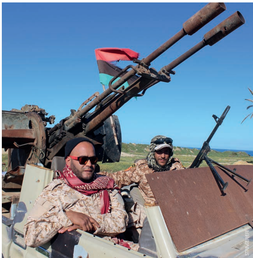
Miembros de la milicia de Misrata patrullan en abril de 2019 la capital de Libia, Trípoli, para intentar detener la ofensiva de las fuerzas del mariscal Haftar. A la izquierda, migrantes en el centro de detención de Nijla tras huir de otro centro destruido por los ataques. Naciones Unidas cifra en algo más de 200.000 los niños atrapados en Trípoli.