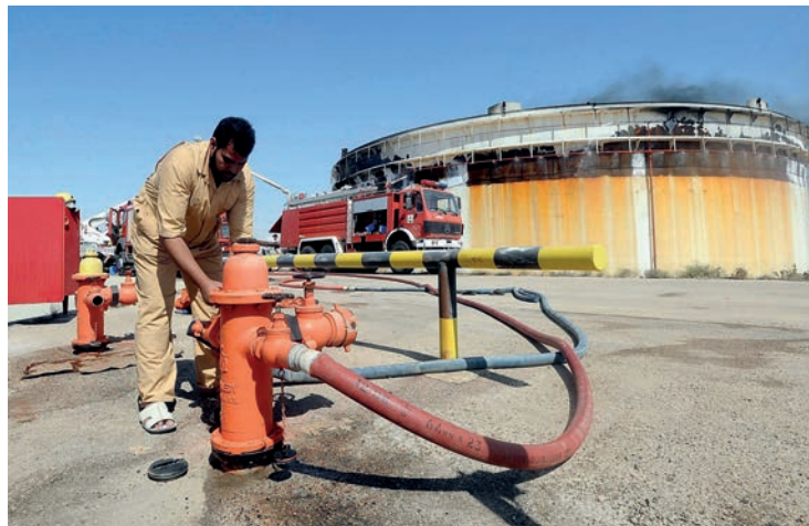
Un hombre conecta la manguera de bomberos a una hidrante junto a un tanque de petróleo atacado en la ciudad libia de Bengasi.

en medio, las víctimas civiles. Según el último informe de UNICEF presentado en Berlín durante la Conferencia de estos meses de enero, cerca de 200.000 niños no tienen acceso a sus escuelas en Trípoli a causa de los combates y la capital sufre problemas con la red sanitaria; ACNUR cifra en algo más 700.000 el número total de migrantes varados en el país y en unos 200.000 los desplazados internos que huyen de la guerra. Por su parte, Amnistía Internacional indica que hay 20 millones de armas incontroladas (tres por cada habitante) y la ONU afirma que el número de muertos civiles en 2019 fue de 283. En realidad, el número total de muertos ha sido bastante mayor,