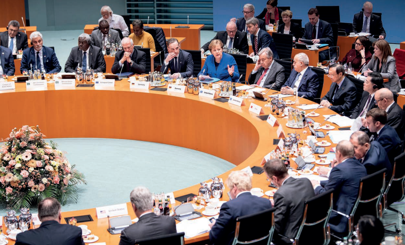
Angela Merkel y Antonio Guterres junto a mandatarios de todo el planeta durante la Conferencia internacional celebrada el pasado 19 de enero en la capital alemana con el objetivo de detener la escalada bélica en Libia y sentar las bases para un proceso de reconciliación.