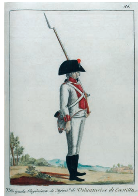
Libro Estado militar gráfico de 1806. MDE

E UROPA vivía años convulsos tras el estallido de la Revolución francesa (1789-1799). El proceso del derrocado Luis XVI causaba un ambiente internacional hostil hacia el nuevo régimen, que se recrudeció cuando el monarca fue ejecutado en la guillotina en enero de 1793.