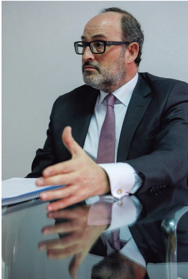
«La ciberseguridad es un factor de supervivencia y de competitividad para las empresas», sostiene el presidente de TEDAE.