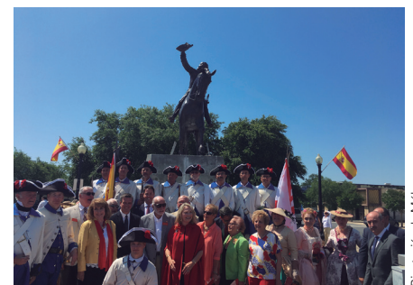
Diputación de Málaga

Y, en este espacio, uno de los nombres propios es Bernardo de Gálvez (ver RED núm. 323) que, el 8 del pasado mayo, ha sido asimismo protagonista en otra ciudad estadounidense: Pensacola,