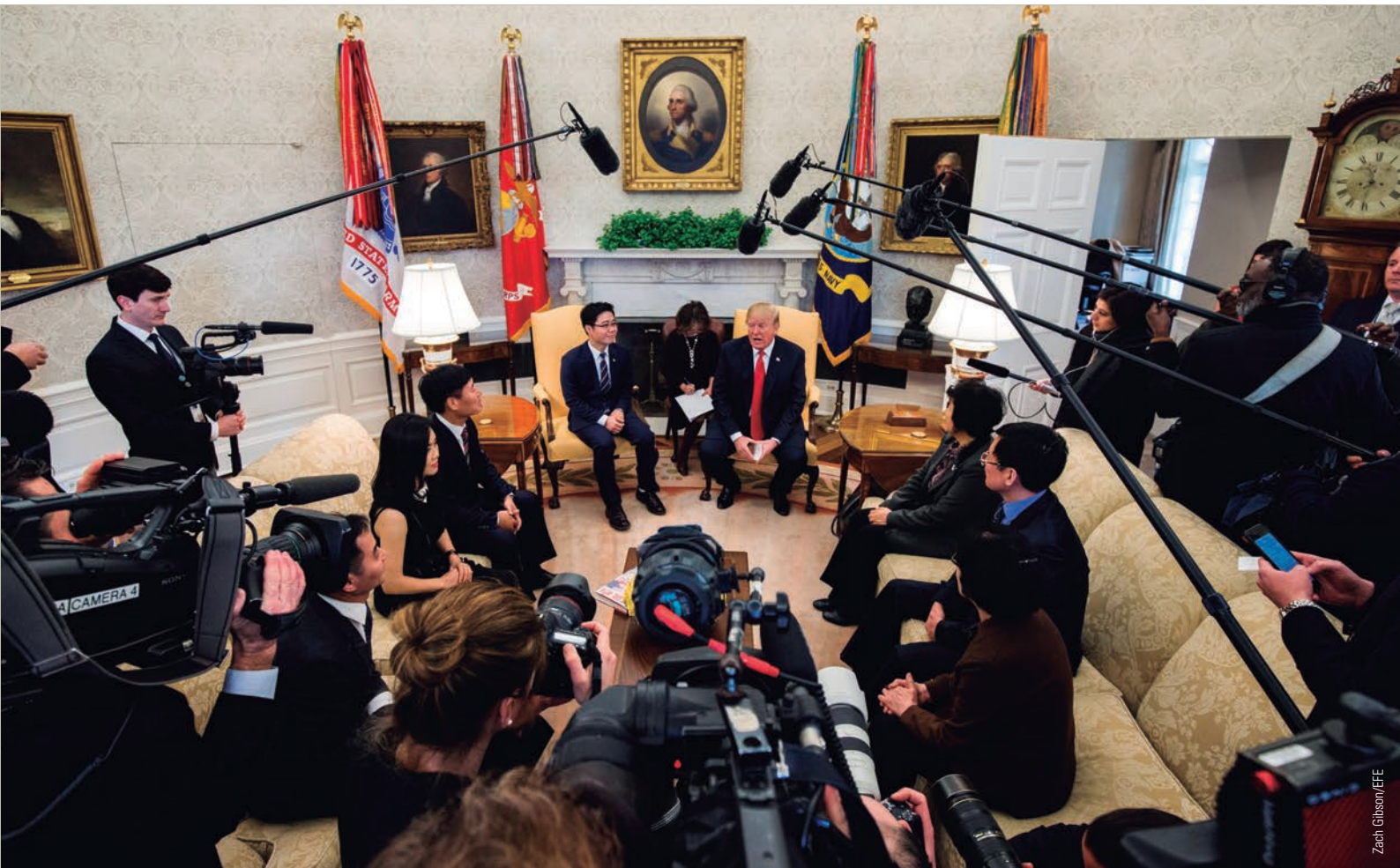
El presidente estadounidense, Donald Trump, que quiere convertir el posible acuerdo con Pyongyang en su gran éxito internacional, se dirige a los medios de comunicación durante un encuentro con desertores norcoreanos en febrero de 2018.

los resultados no son los esperados), su mera convocatoria supone un hito en la relación de los dos países. En cuanto a la «baza atómica», Kim Jong Un puede aún sorprender presentando a su homólogo norteamericano un calendario preciso para destruir las armas nucleares ya en su posesión, lo que, unido a la eliminación de los laboratorios y polígonos de ensayo de pruebas atómicas ya previstos, daría a Trump la aureola como artífice de la neutralización del peligro norcoreano.