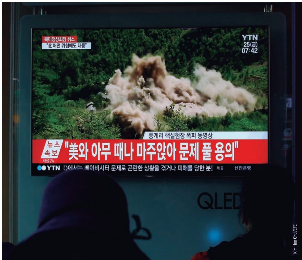
Surcoreanos miran en Seúl la noticia del supuesto desmantelamiento del centro de pruebas nucleares de Corea del Norte, el complejo Punngye ri, el día 25 de mayo.

L O que está ocurriendo en Asia oriental, inaugura un nuevo escenario mundial. La sorprendente apertura de negociaciones entre el régimen de Corea del Norte y, con su vecino del Sur primero, y con los Estados Unidos después (y por extensión con el mundo occidental), se puede considerar, si se lleva a buen puerto, como el cerrojo de la Guerra Fría. Se pone fin a una era delimitada por el enfrentamiento entre dos sistemas imperantes en el siglo XX e incompatibles entre sí: el capitalista, liderado por Europa y EEUU, y el social-comunista, encarnado en su momento por la URSS y su área de influencia y ahora con dos exponentes muy diferentes: China y, sobre todo, Corea del Norte. Los servicios