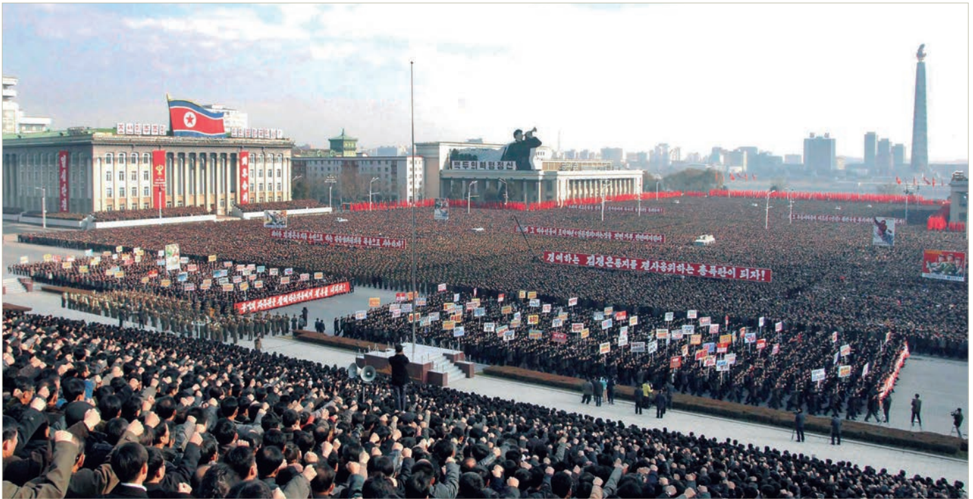
Durante decenios —en la foto, un desfile del día de la nación en 2016— el régimen norcoreano ha mantenido una parafernalia en la que ha organizado multitudinarios actos para manifestar apoyo popular a su líder supremo y benefactor.

no quiere quedarse a un lado. Xi Jinping no ha jugado aún su última baza.