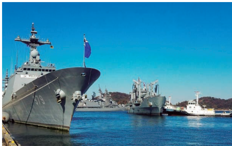
Buques de Corea del Sur, Japón y EEUU atracan en el puerto nipón de Yokosuka durante unas maniobras conjuntas en diciembre de 2017.

Un eventual Tratado de paz, el establecimiento de relaciones diplomáticas entre EEUU y Corea del norte, previo a la unificación de la península, tendría necesariamente algunas consecuencias en el despliegue geoestratégico de Washington en la región. Por el momento, la atención se centra en la próxima reunión cumbre entre Trump y Jong Un, del próximo el 12 de junio. No obstante, los tira y afloja de uno y otro (Trump dijo que no iría, pero el 1 de junio cambió de opinión y confirmó que sí) levantan ciertas dudas. Incluso si la reunión comienza, el presidente Trump ha dejado claro que podría dar el portazo si