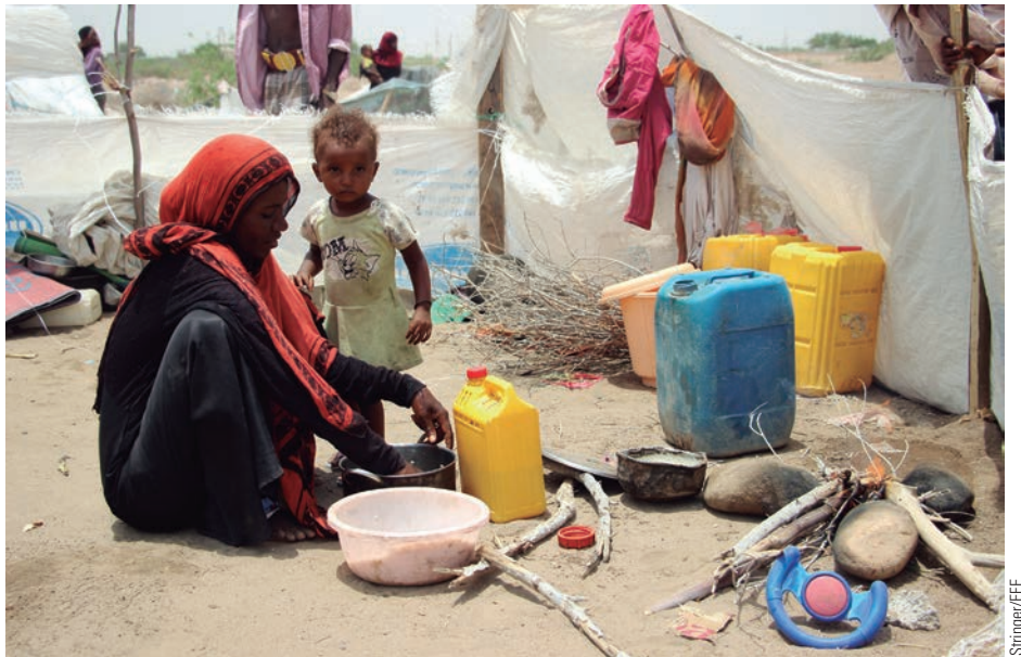
Una mujer desplazada prepara la comida en un campamento en la provincia de Lahj.

Y entre todo este drama, la desesperación ha llevado a convertir el tráfico de órganos es una opción más de los ciudadanos yemeníes para sobrevivir a la hambruna. Según explica un representante de la Organización Yemení contra la Trata de Personas, el aeropuerto de Sayún (en el noreste del país) y Adén al sur son el punto de partida para las más