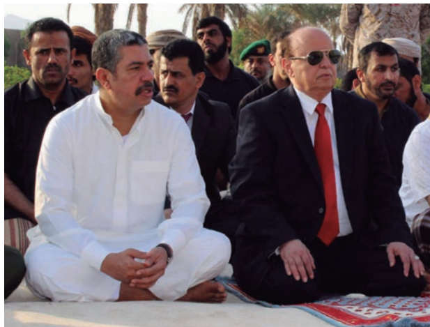
El presidente yemení, Mansur al-Hadí (dcha.) y el primer ministro, Eid al Adha, durante una fiesta de oración.