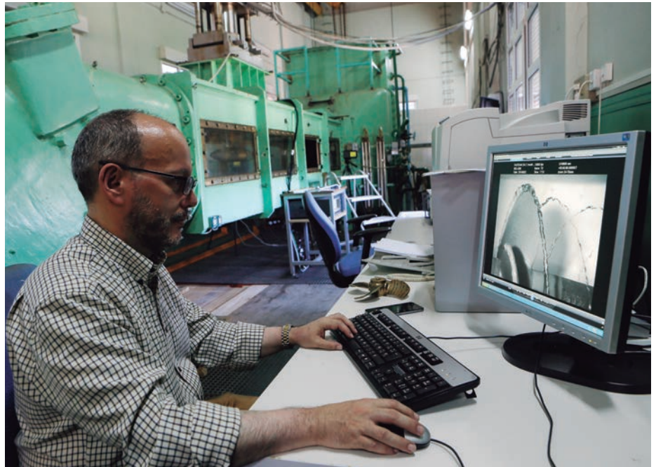
Desde el puesto de control del Túnel de Cavitación, un técnico comprueba los parámetros de un experimento con el modelo de una hélice.

El piragüista David Cal, el deportista español con más medallas olímpicas —cinco en tres participaciones, de 2004 a 2012— realizó ensayos con su canoa monoplaça en el Canal de Aguas Tranquilas, pruebas que le sirvieron para comprobar la técnica de palada, la posición longitudinal y el peso del tripulante según las condiciones de viento previstas en la competición. Asimismo, en las tres ocasiones