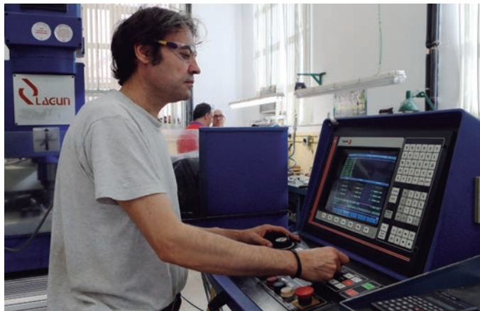
El diseño de los modelos de los buques está totalmente informatizado y se realiza con programas de software propios.

desarrollo de la hidrodinámica con más de 25.000 ensayos realizados. El centro se integró en 2014 en el Instituto Nacional de Técnica Aeroespacial (INTA) y, desde entonces, es el núcleo de la Subdirección General de Sistemas Navales de dicho organismo.