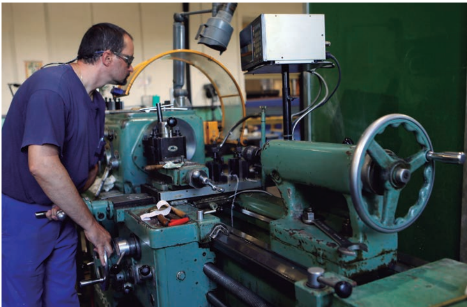
El taller mecánico del CEHIPAR está dotado con todas las herramientas estándar para el trabajo del metal, como tornos, fresas, cepillos, etcétera.