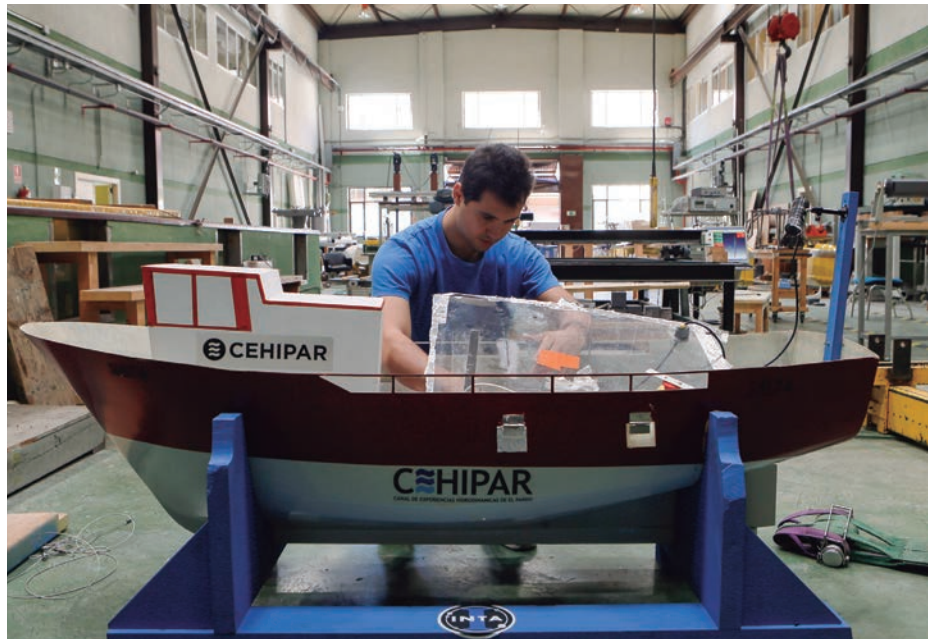
En los talleres del centro se construyen los modelos a escala de las embarcaciones que luego se introducen en los canales para realizar los experimentos.

Las instalaciones del centro se completan con los talleres, donde se construyen los modelos a escala que se utilizan en los experimentos. El diseño se realiza con programas de software propios y para su transformación a lenguaje máquina se utilizan estándares