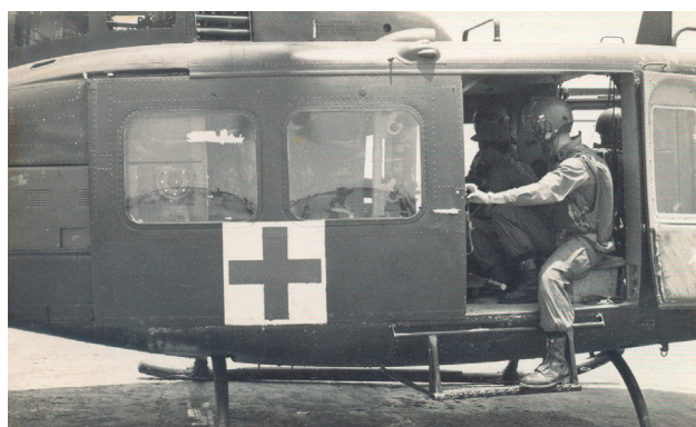
Los helicópteros jugaron un papel clave en el conflicto, en especial, para la evacuación médica de los heridos.

Ésta fue una zona muy próxima a dos puntos clave del conflicto. Por un lado, estaba cerca de Saigón, la capital sureña, principal centro operativo de las fuerzas sudvietnamitas y su aliado Estados Unidos; por otro, quedaba ubicada en el entorno de la llamada ruta Ho Chi Minh , vía de tránsito habitual de