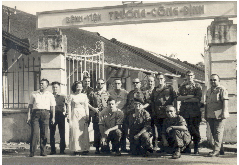
Algunos de los médicos y enfermeros militares participantes en la misión junto a personal del propio centro sanitario de Go Cong en su puerta principal.

Dicho reconocimiento institucional y popular contrasta con el tratamiento que la operación tuvo en España, que llegó a contar con el sello de secreto o confidencial en algunos de sus documentos, recoge la muestra, cuyo catálogo incluye una