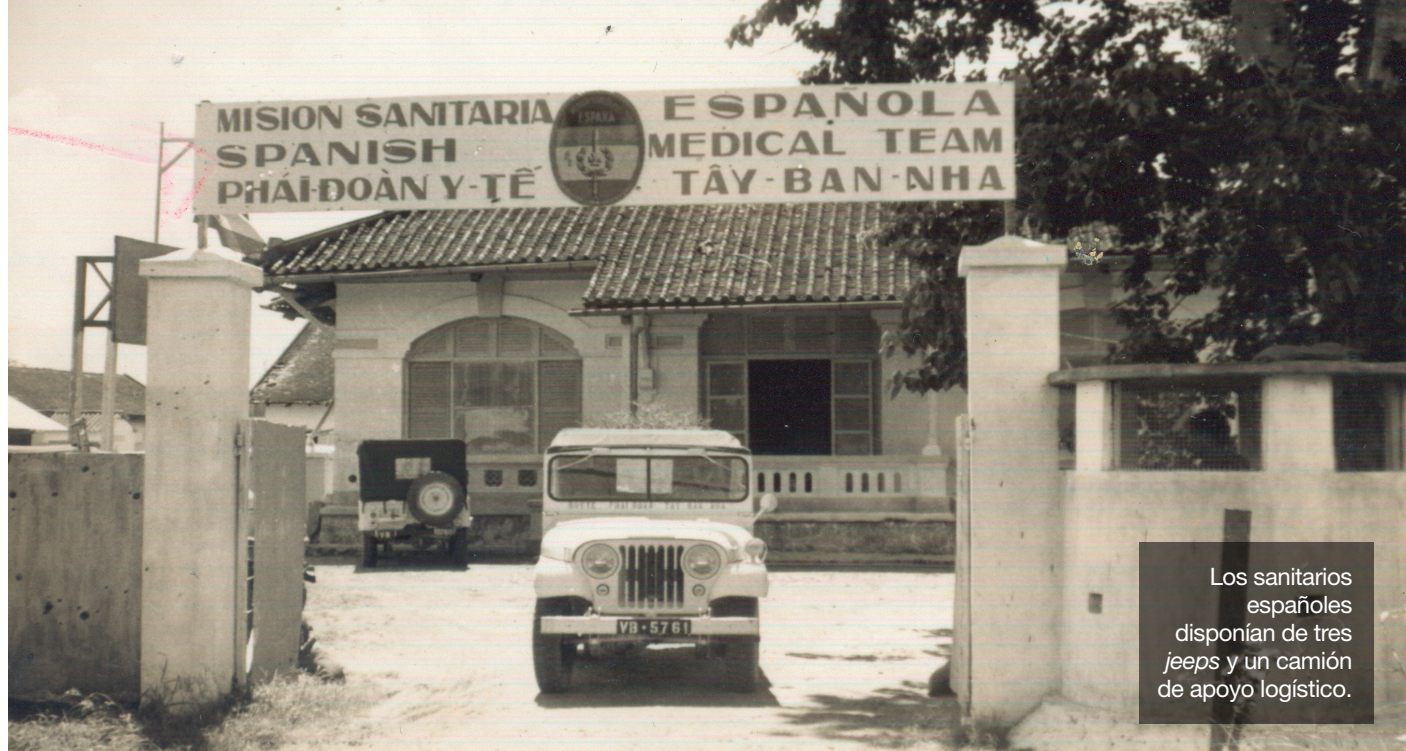
Los sanitarios españoles disponían de tres jeeps y un camión de apoyo logístico.