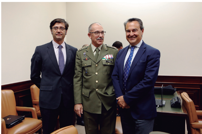
El subsecretario de Defensa, el JEMAD y el SEDEF, acudieron al Congreso para informar sobre las asignaciones en los distintos órganos del Departamento.

De los 1.824,48 millones de euros asignados a los programas especiales de armamento, 716,76 millones se emplearán en pagar las cantidades no abonadas en 2016 y los restantes 1.107,72 millones en las previstas para 2017. Ello supone 1.817,63 millones adicionales a los 6,84 millones que en los anteriores ejercicios se destinaban a dichos programas. En la X Legislatura se optó por una fórmula distinta para pagarlos, consistente en la aprobación de créditos extraordinarios mediante los correspondientes reales decretos-leyes, pero el Tribunal Constitucional declaró anticonstitucionales y nulos los dos últimos, los de 2014 y 2015.