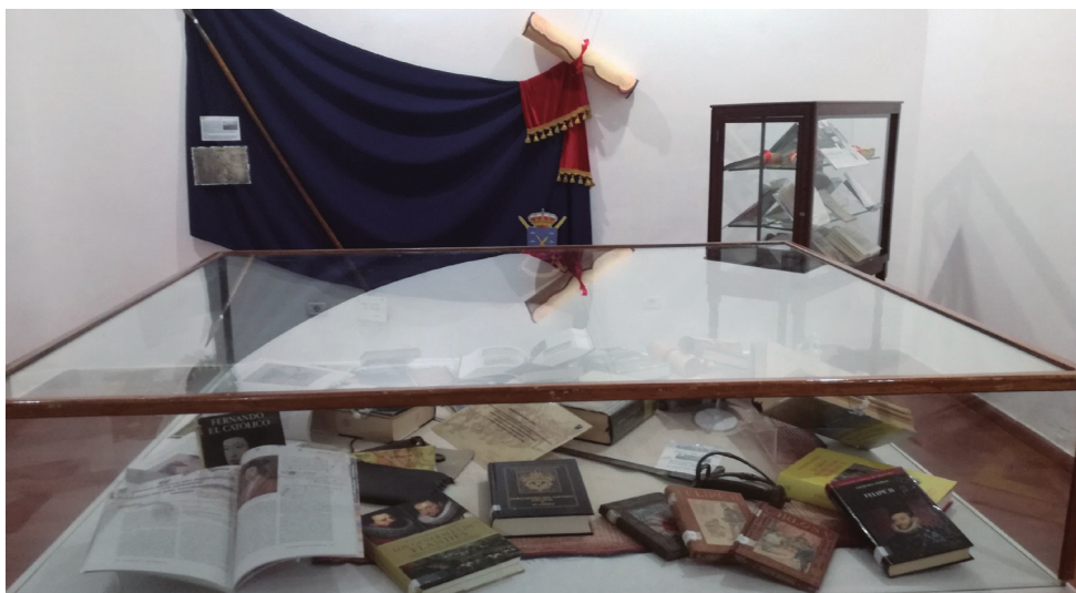
Vitrina en la que se pueden ver algunos títulos dedicados a sus protagonistas.

Centro de Historia y Cultura Militar de Canarias