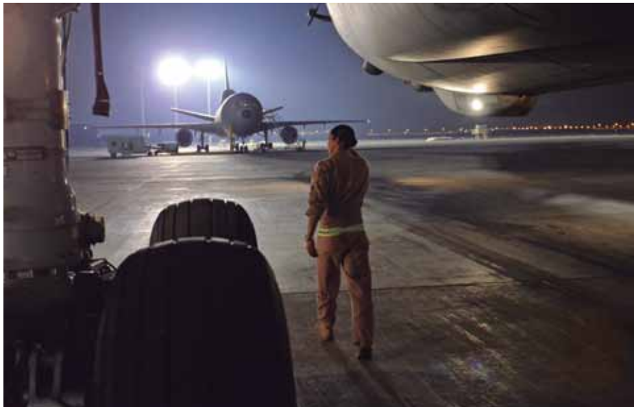
Jefferson Heland/US Army

Pero era imposible parar el avance del EI. Había que hacer más. Y fue durante una cena informal de la reunión de la cumbre de la OTAN en Cardiff en los primeros días del pasado mes de septiembre, cuando los jefes de Estado y Gobierno de los aliados, encabezados por Estados Unidos, coincidieron en que era necesario crear coalición militar multinacional ad hoc complementada con acciones políticas. La OTAN, como tal, mantendría sus labores de