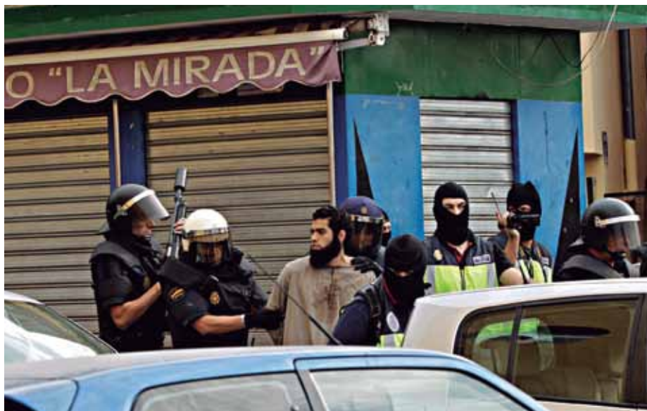
La policía nacional detiene en Melilla a uno de los miembros de la supuesta célula terrorista vinculada al El que fue desarticulada el pasado 26 de septiembre.

—Alemania, Arabia Saudí, Argelia, Egipto, Emiratos Árabes Unidos, Francia, Italia, Qatar, Reino Unido, Túnez y Turquía—, además de la UE y la ONU, con su Representante Especial para Libia, el español Bernardino León.