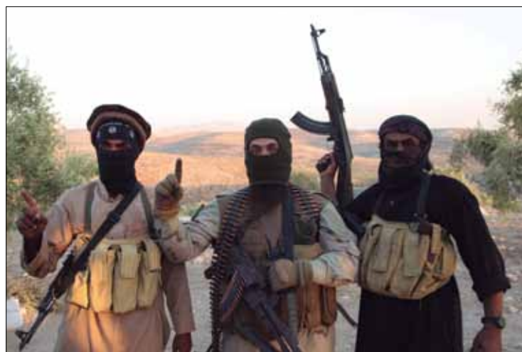
Militantes del Estado Islámico en una imagen propagandística tomada en la ciudad siria de Alepo el pasado 30 de septiembre.