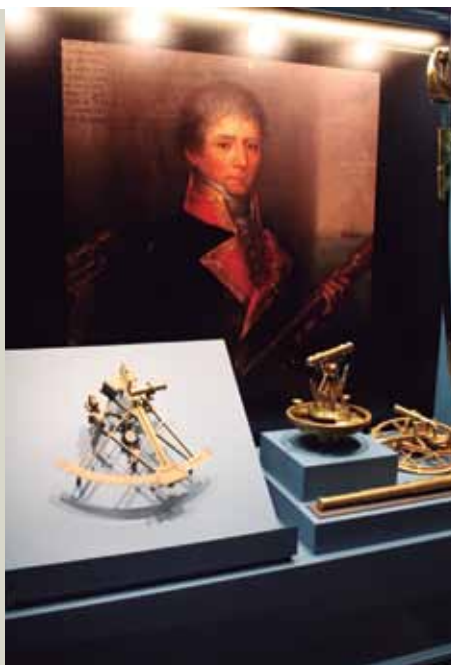
José de Bustamante y Diego de Alvear, jefes de la escuadra hispana.