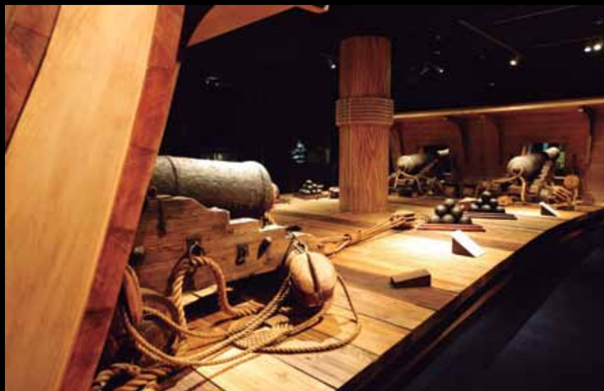
Arriba, sección de medio puente de la cubierta de la Mercedes . Detalle del modelo creado para la muestra (izda.).