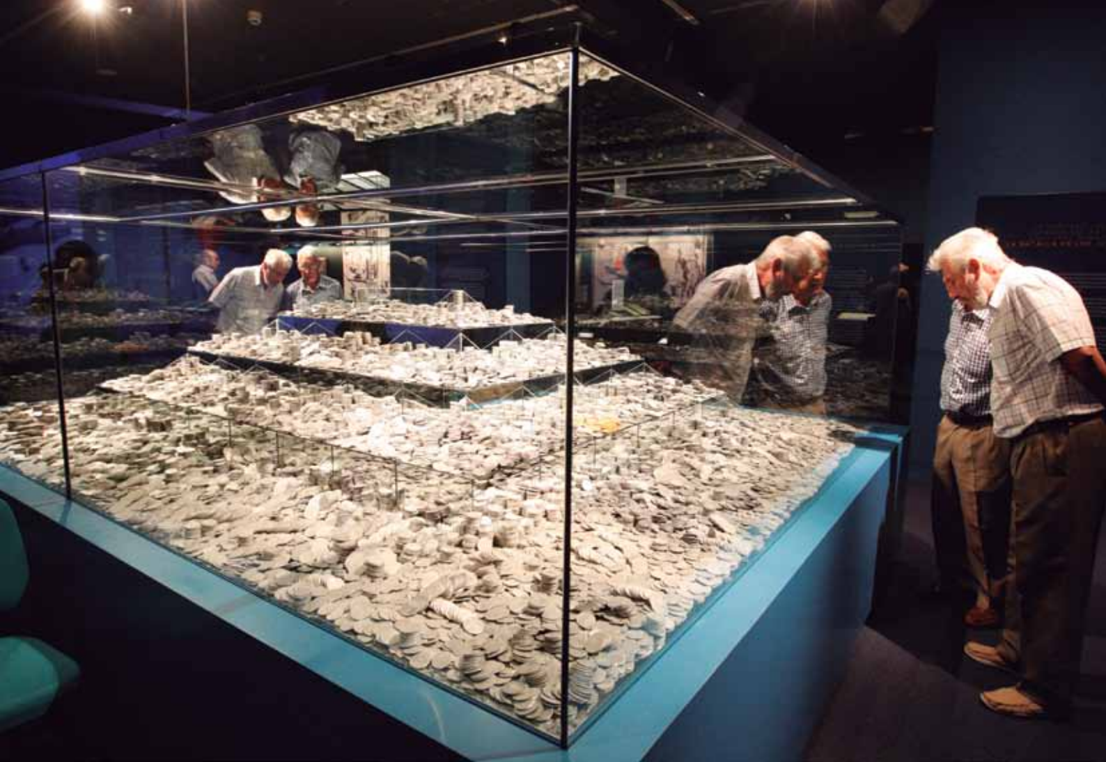
Más de 30.000 monedas de plata de a ocho reales y 146 escudos de oro hacen referencia al cargamento de caudales de la nave.