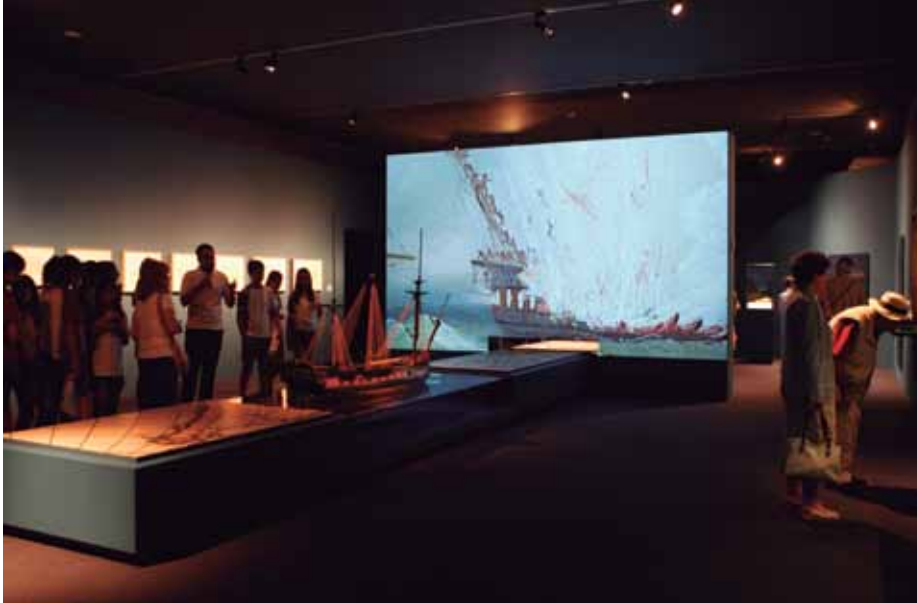
Un proyectil de cañón en la santabárbara hizo volar el buque español durante el ataque británico, momento que recrea este audiovisual en el Arqueológico.