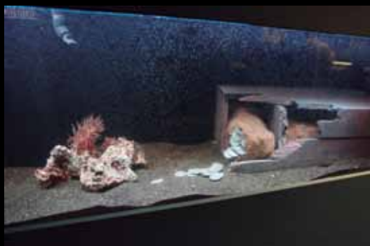
El transporte pecuniario se distribuía en talegas de unas mil piezas, como se recrea en el montaje de la exposición.