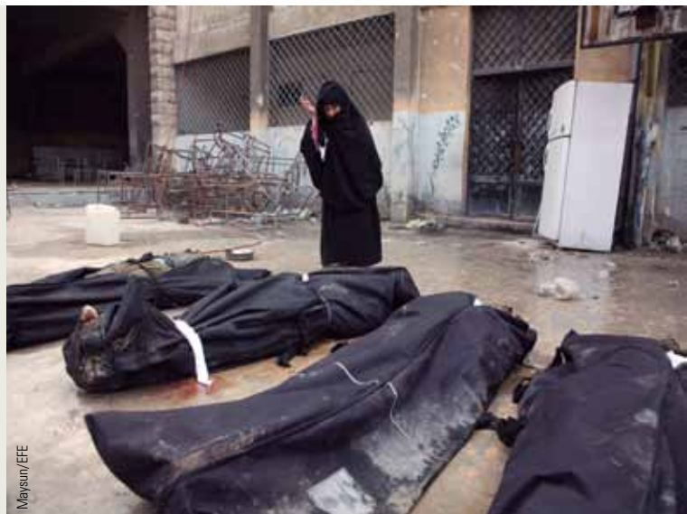
Una mujer contempla en marzo de 2013 los cadáveres de civiles encontrados flotando en el río Quweiq de Aleppo con claras muestras de tortura.

Pero, en la inmensa mayoría de los casos, el hecho de que se tratase de vídeos y fotografías enviadas siempre por miembros del Ejército Libre de Siria mermaban su impacto y, sobre todo,