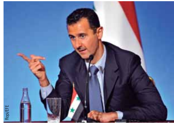
Basher al Assad se mantiene firme y en absoluto dispuesto a hacer concesiones.

El régimen sirio ha demolido de manera intencionada barrios enteros. En la foto, la zona de Al-Sukkari de la ciudad de Aleppo.