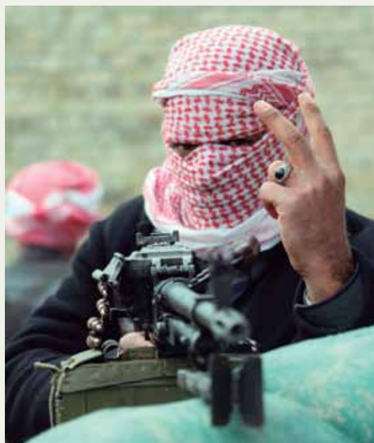
Un yihadista del Estado Islámico de Irak y Levante patrulla la ciudad de Faluya el pasado 5 de enero.

El temor más serio —y previsible— es que se consolide el control de Al Qaeda en la zona y que consigan mantener un feudo desde el que expandir su «guerra santa» y resquebrajar el actual estatus administrativo y fronterizo. Lo único positivo de esta ofensiva ha sido la respuesta de la población local. La inmensa mayoría de los suníes y no sólo los jefes tribales del partido Sahwa, tradicionales aliados de Maliki, han dicho basta y se han enfrentado a los terroristas. Es la primera vez que ocurre en Irak y ya está sucediendo en Siria. Quizás esa sea la verdadera opción para acotar las aspiraciones territoriales de Al Qaeda.