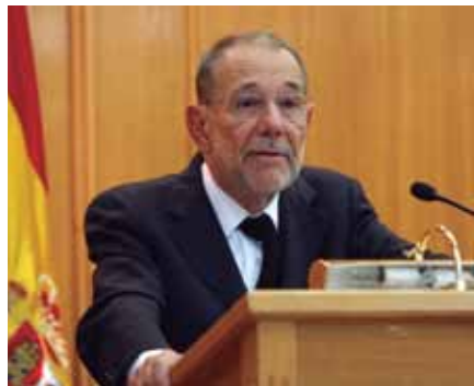
Javier Solana habló sobre seguridad, interdependencia y responsabilidad.