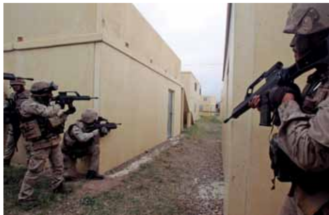
El nuevo Mando Conjunto de Operaciones Especiales se ha instalado en el acuartelamiento Retamares .

El ministro señaló que la estructura de los Ejércitos también se ha visto simplificada a consecuencia de un anterior Real Decreto, aprobado el pasado 20 de junio, que establecía la nueva estructura del Ministerio de Defensa. Dicha norma «atribuye al secretario de