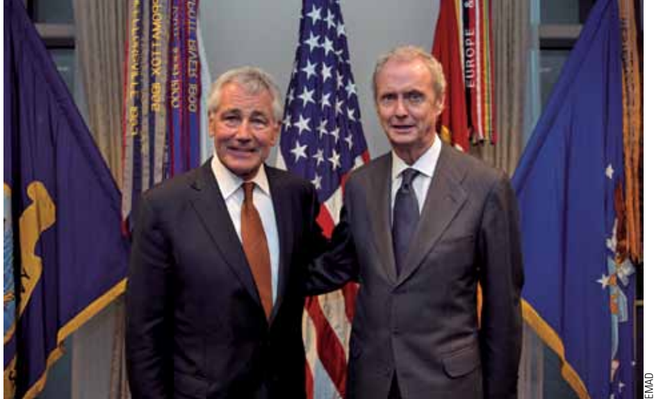
Chuck Hagel y Morenés se reunieron en el Pentágono, en Washington.